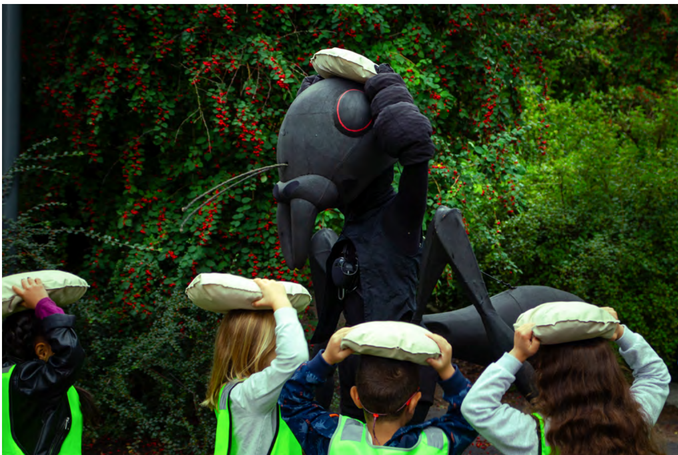
Maur, Rom for dans/Polyglot theatre I Scenekunstbrukets repertoar og Showbox 2023