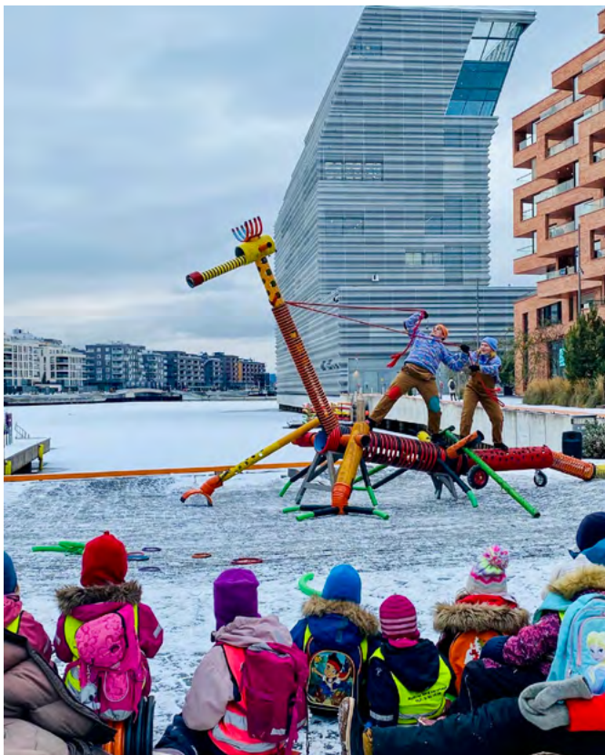
Bare rør, Panta Rei Dansteteater/ Unge Viken Teater Showbox 2023