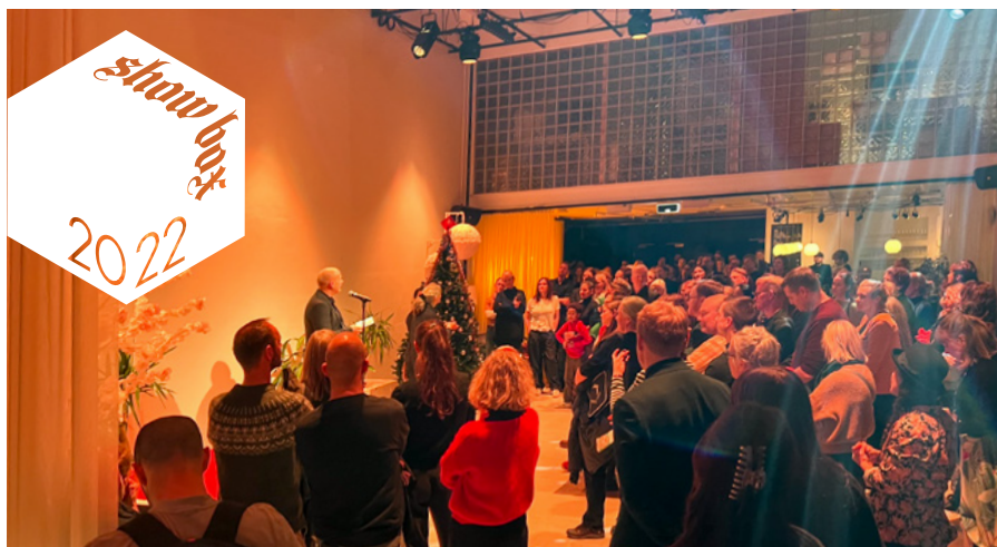
Åpningen av Showbox 2022.