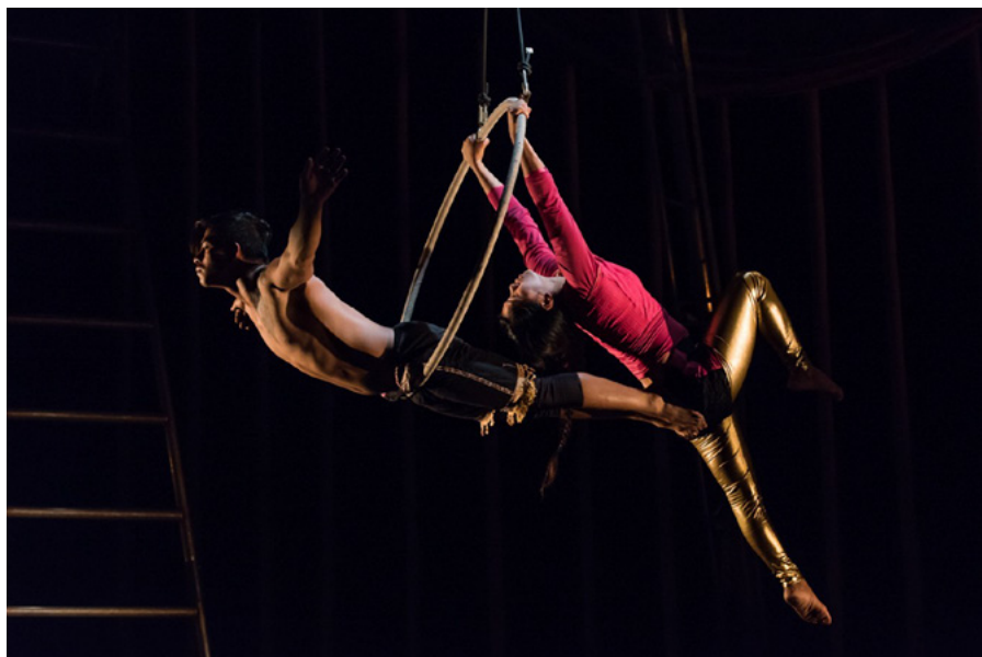
As A Tiger In The Jungle, Cirkus Xanti. i Scenekunstbrukets repertoar.

I 2022 har vi aktivt tatt i bruk vårt nye arbeidsverktøy for behandling av søknader for både administrasjon og kunstnerisk råd. Dette kommer feltet til gode med nye stabile løsninger for å søke om opptak og for arbeidsflyt internt. Vi har et stort forestillingsarkiv, som inneholder mer enn 1000 digitaliserte videoer av scenekunstproduksjoner fra 1994 og frem til i dag. Dette er en omfattende, nasjonal oversikt over produksjoner på det frie feltet.