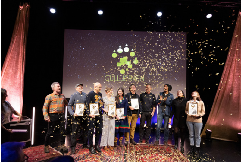
Vinnere av Gulljerven 2022

Gulljerven er en pris som hedrer kunstnere, kompanier, utøvere, teknikere, turnéleggere og andre som står på for å få scenekunsten ut til barn og unge i Norge. Gulljerven lanserer stadig nye tilskudd av aktuelle, men ofte underkjente kategorier, som er viktige for å løfte feltet.