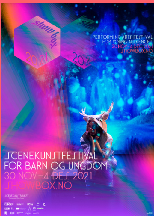
Never AFK Hafnor/Erichsen