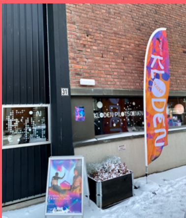
Historier om å (ikke) komme hjem Issa/Lopez/Gato Kloden Pilotscenen