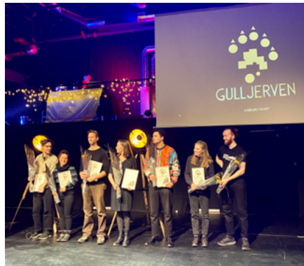
Vinnere av Gulljerven 2021